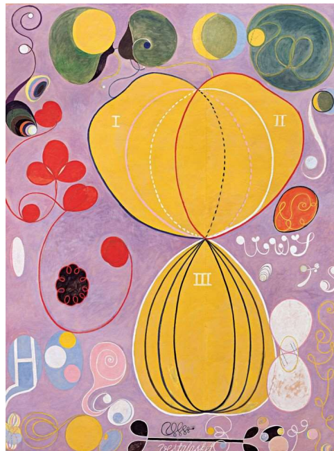
« The ten largest, no7 » 1907

L'art abstrait s'attarde sur les lignes, les formes et les couleurs sans représenter le monde réel. Tu peux t'inspirer du tableau ci-dessous, réalisé par l'artiste suédoise Hilma af Klint :