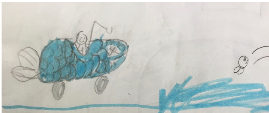
Voiture d'un pêcheur